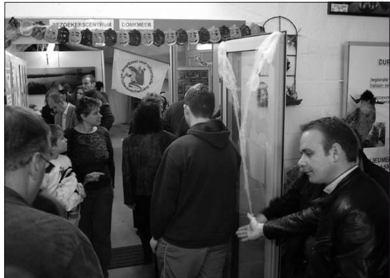
Tijdens het Pompoenfestival van VVV-Donkmeer werd door JNM-Durmeland in het bezoekerscentrum Donkmeer een leuke Spinnen- en Vleermuizen-tentoonstelling georganiseerd die wel 1000 bezoekers aansprak!