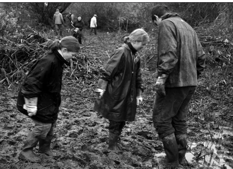
De Dag van de Natuur op 19 november werd een heerlijke ploeterdag voor jong en oud.

Educatief medewerker van v.z.w. Durme aan het Donkmeer V.z.w. Durme – Natuur langs Durme, Donk en Schelde Bezoekerscentrum Donkmeer Festivalhal Donklaan (A. Nelenpad) Berlare 09 348 30 20 (kantooruren) of 052 45 31 41 donk@vzwdurme.be en www.vzwdurme.be