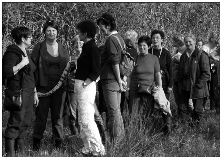
Dames van de Zilveren Passer uit Zele, op zoek naar het noorden.