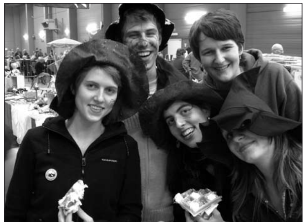
JNM-heksen... ze bestaan!