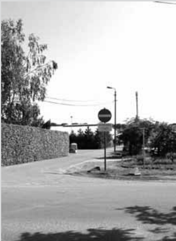
1. Bollewerkstraat richting containerpark