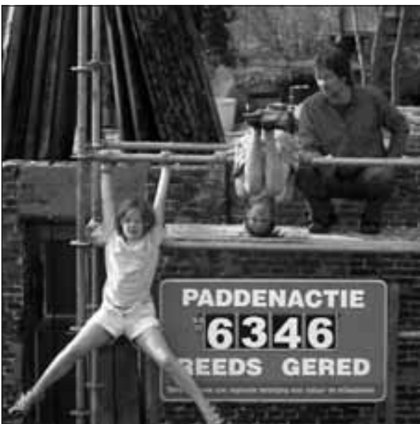
Met 6346 de grootste Vlaamse actie!

De paddenoverzetactie in de Dijkstraat was ondanks de dijkwerken ook dit jaar zeer succesvol. Tientallen vrijwilligers hebben samen 6346 amfibieën veilig de straat overgezet: voornamelijk Gewone pad (6328 exemplaren) en kleine aantallen Groene kikker (2), Bruine kikker (1) en Kleine watersalamander (15). Voor zover de cijfers van alle Vlaamse acties bekend zijn... gaat het in Zele-Berlare over de grootste overzetactie van Vlaanderen!