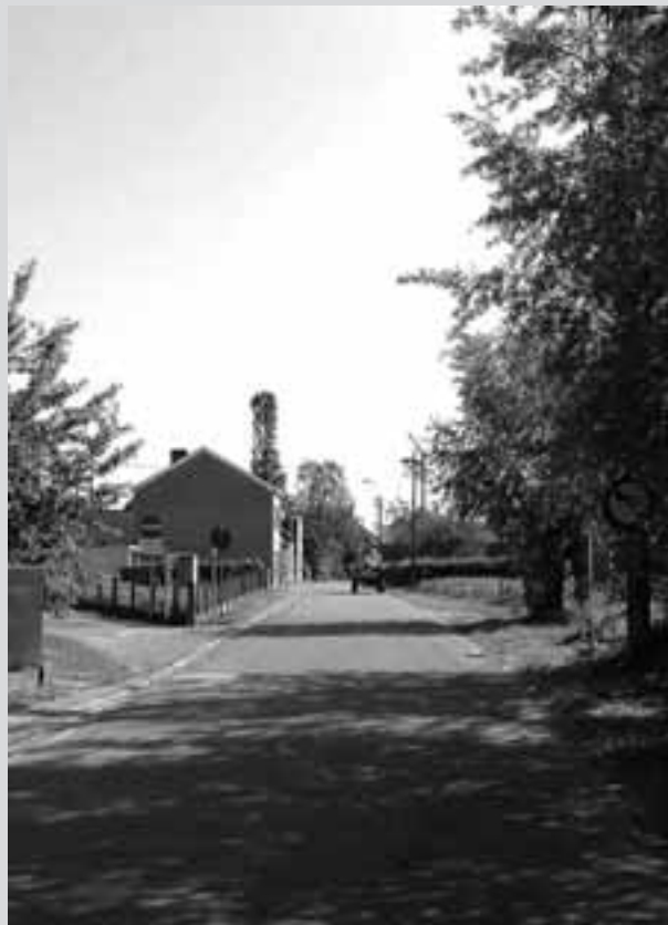
2. Sarosstraat richting Em. Hertecantlaan