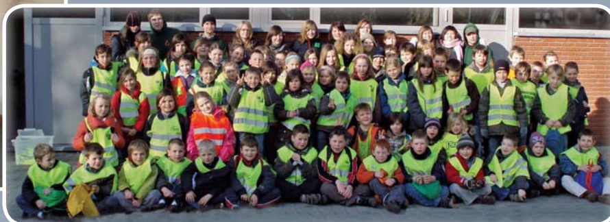
De SKWATdag van de Jeugdraad kon op heel wat belangstelling rekenen.