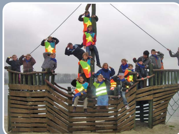
Kinderen genoten tijdens de paasvakantie van een te gek gemeentelijk speelplein in het teken van piraten.