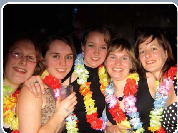
HUDI's Beachparty op paaszaterdag was een meer dan geslaagd evenement.