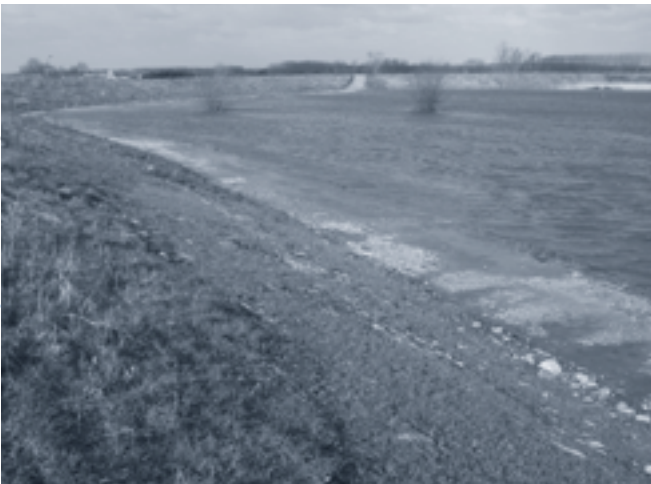
Beeld van het overstroomde Scheldebroek, gezien van op de ringdijk.

Wandeling langs het natuurschoon van de Scheldebroeken op het grondgebied van Zele en Berlare met aandacht voor de recent verhoogde ringdijk. De afstand bedraagt ongeveer 7 km; stevige schoenen zijn aangeraden.