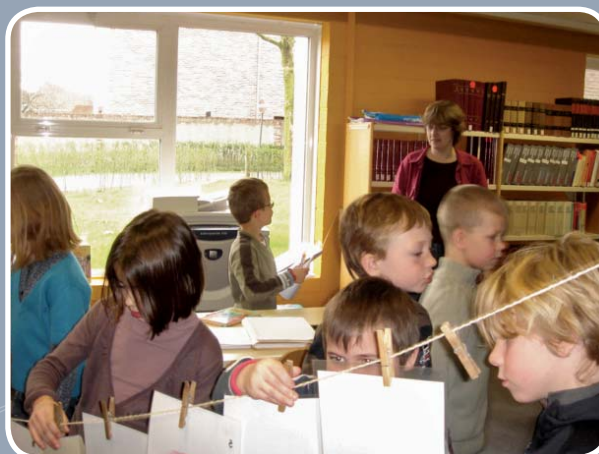
Jeugdboekenweek 2008: kinderen verkennen de bib!