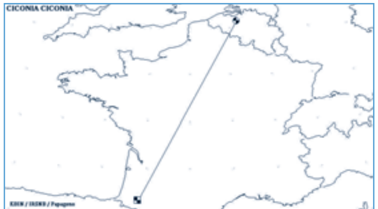
Dit kaartje geeft de trekroute weer van de gesneuvelde Berlaarse ooievaar.

V.z.w. Durme kreeg echter onlangs slecht nieuws: een van de jongen was - zoals de natuur het voorschrijft - zijn herfstreis naar het zuiden begonnen, maar raakte niet over de Pyreneeën. De terugmeldingsfiche meldt dat de jonge reiziger dood gevonden werd op 25 augustus in Viellesequire, in de Franse Pyreneeën. Dit jong was amper 4 maand oud. Hopelijk vergaat het zijn twee broertjes/zusjes beter en zien we hen volgend jaar terug... aan de Donk!