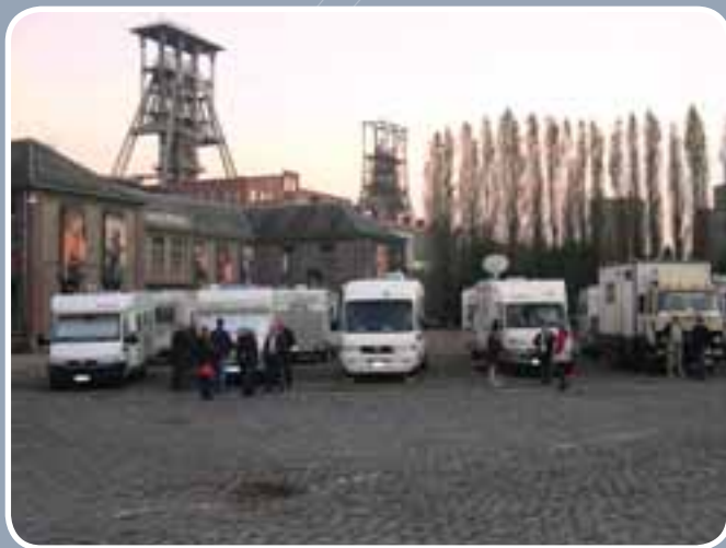
De groepsuitstap van de Turfputzwervers ging dit jaar naar Haspengouwen en Midden-Limburg. Eindstation: Beringen-Mijn.