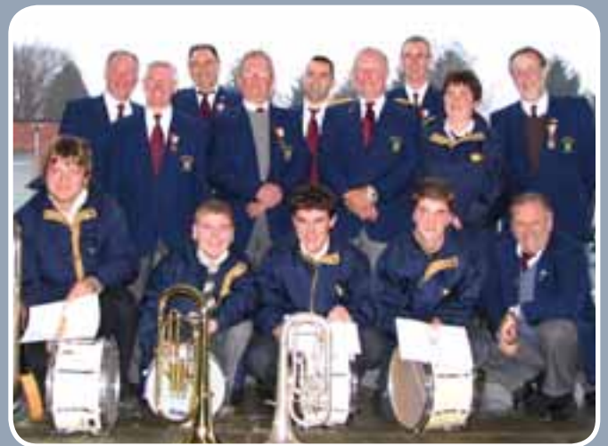
Ter gelegenheid van het 144 ste Sint-Ceciliafeest kregen enkele trouwe korpsleden van de K.F. De Verenigde Vrienden een ereteken.