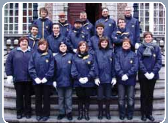
De Overmeerse drumband herdacht met tromgerof de Boerenkrijg in Hasselt.