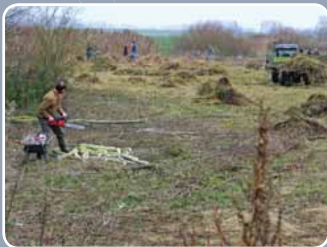
Dag van de natuur (15/11): enthousiaste natuurliefhebbers uit Berlare en Zele staken de handen uit de mouwen in het Scheldebroek.