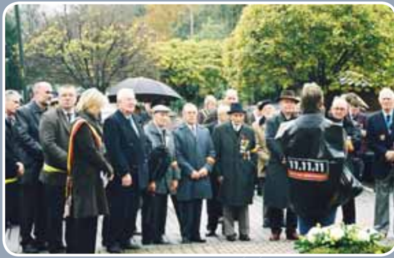
De 11.11.11-actie bracht in onze gemeente 4.815 euro op. Bedankt aan alle schenkers én alle vrijwilligers.