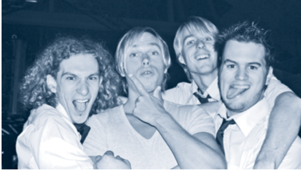
Vatos Locos DJ Team met Regi