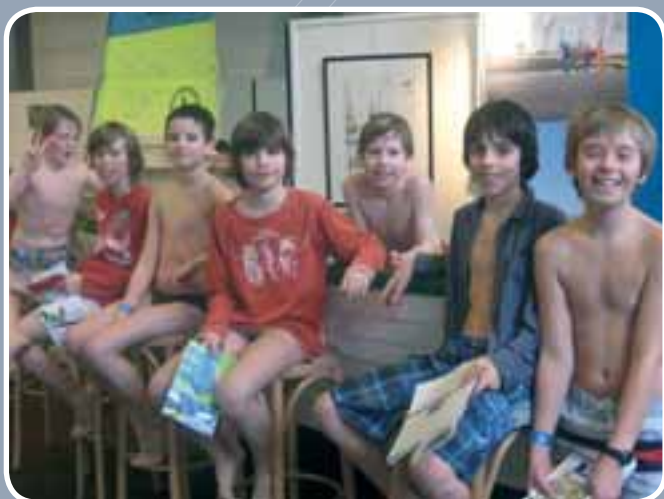
Het 5 de en 6 de leerjaar van VBS Donk genoten in Gent van een fantastische WATERFUN-prettdag!