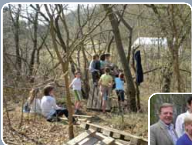
Kampen bouwen op de buitenspeeldag van 1 april.