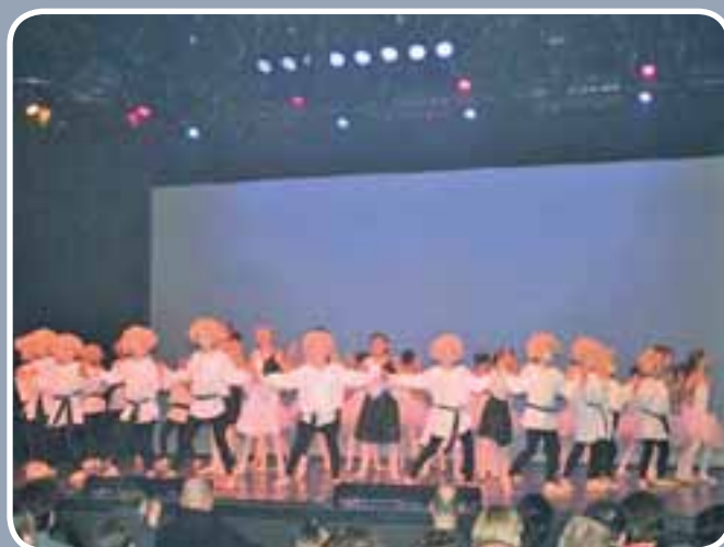
25 jaar Balletschool Terpsichore werd uitgebreid gevierd met drie uitverkochte voorstellingen in CC Stroming.