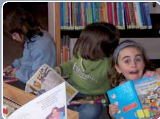
Tijdens de jeugdboekenweek brachten leerlingen van de vrije basisschool Sint-Jozef Overmere en leerlingen van de gemeenteschool Uitbergen een leerrijk en leuk bezoek aan de bib in Overmere.