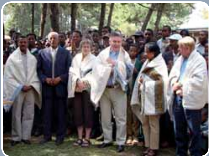
Burgemeester Karel De Gucht bezoekt finadoproject in Ethiopië.