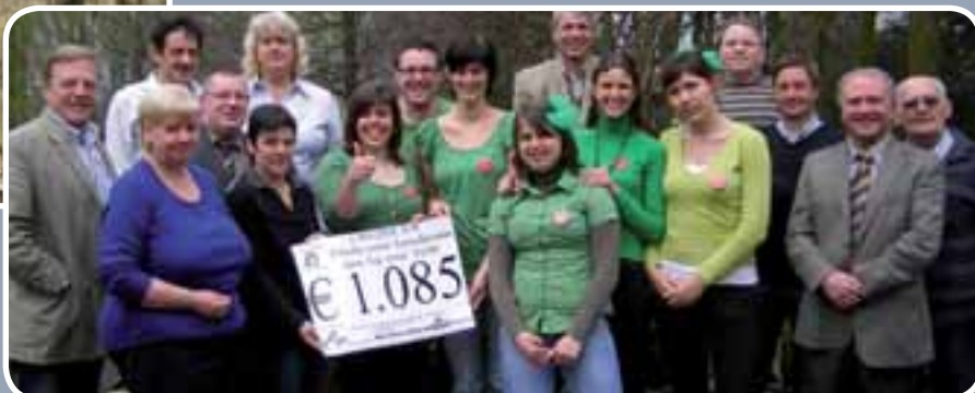
Club 85 schonk de opbrengst van haar winterkermisuijf (1.085 euro) aan het Fonds voor kinderen van bij ons v.z.w.