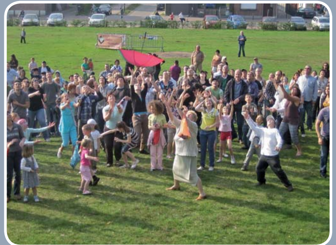
Grabbelen bij de paaseierworp tijdens de opening van het toeristisch seizoen.