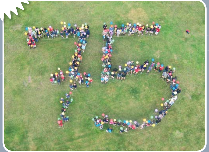
Op zondag 26 april vierden Chirojongens en -meisjes Berlare het 75-jarig bestaan van de Chiro met 'Olé Pistolé'.