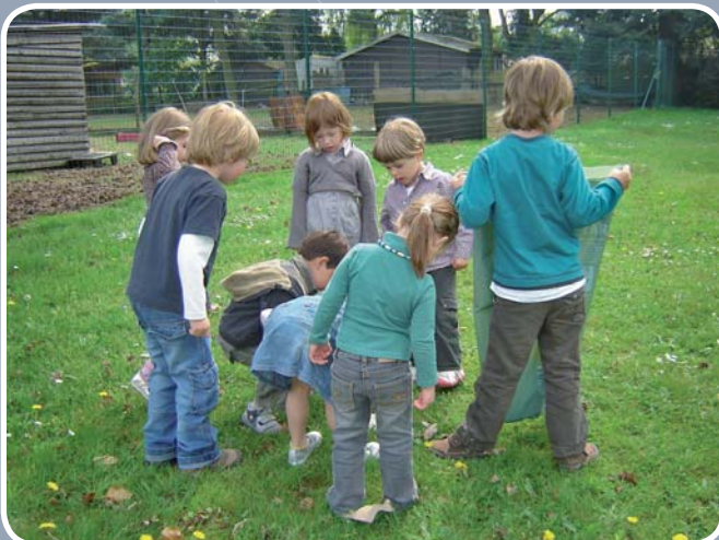
Afval hoort thuis in de juiste zak! VBS Donk wil de leerlingen opvoeden tot milieubewuste consumenten via verschillende activiteiten en projecten.