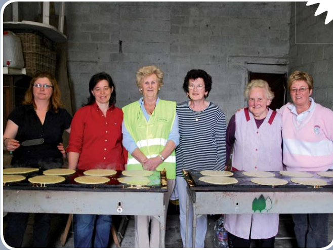
De 'dag van de veiligheid' in de Heikantstraat was een groot succes: het buurtcomité bakte honderden pannenkoeken t.v.v. het Buurtinformatienetwerk en het registreerde fietsen.