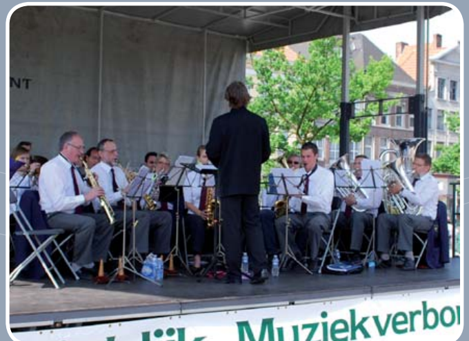
Orkest en drumband van de K.F. De Verenigde Vrienden verzorgden een succesvol optreden op de Vrijdagsmarkt in Gent.