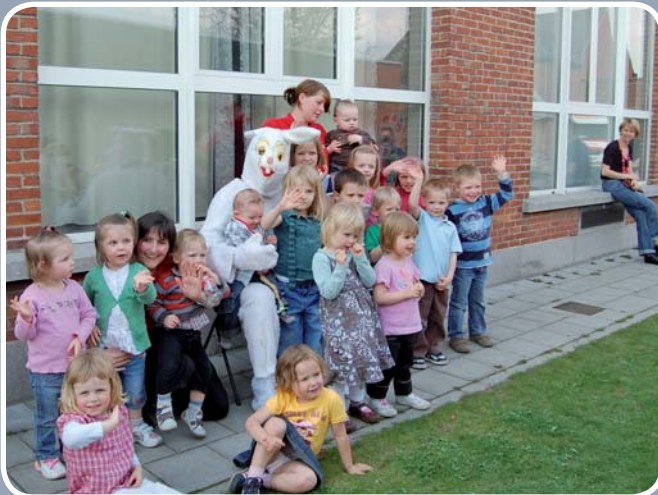
Rode Kruis Berlare nodigde ook dit jaar de paashaas uit, tot grote vreugde van een dertigtal kinderen.