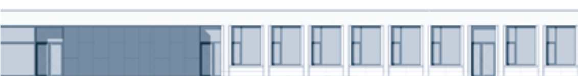
Lokalen kinderopvang in het gebouw langs de voormalige speelplaats.

meer info: technische dienst, 052 43 23 46 en technische.dienst@berlare.be