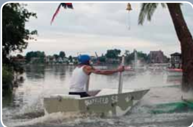
Een massa toeschouwers genoot van Ter land, ter Donk en in het meer.