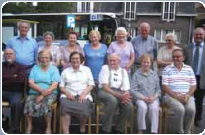
Okra Overmere nodigde alle tachtigplussers uit voor een gezellige namiddag. De oudste invit  was 91 jaar.