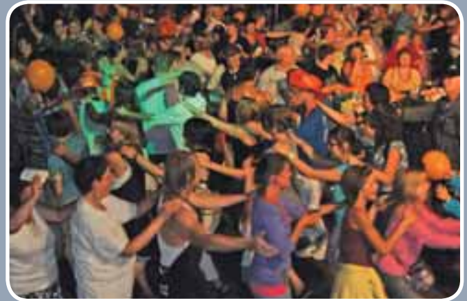
Berlare zingt! overspoelde het Kapelleplein met veel regen, maar gelukkig ook met leuke liedjes en een superambiance!