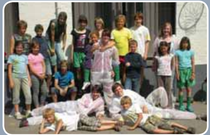
Dikke fun afgelopen zomer op het gemeentelijk speelplein Kaboom!