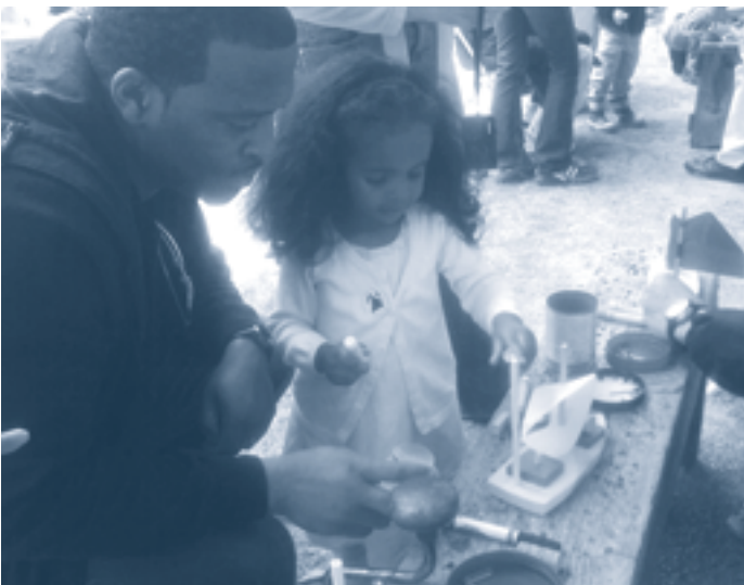
Maak zelf je bootje van afval, net zoals de kinderen in Senegal.

Donckpop v.z.w., de organisator van Lakeside Festival aan het Donkmeer, organiseert op zondag 12 september een AFVALrace voor kinderen. Iedereen mag meedoen en maakt kans op een leuke prijs.