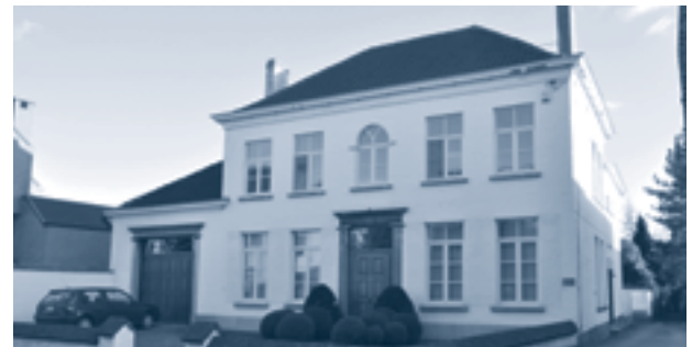
voormalig huis notaris De Weert

zondag 12 september tot zondag 10 oktober | CC Stroming