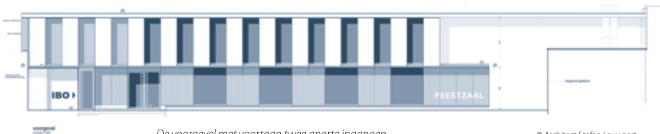
De voorgevel met voortaan twee aparte ingangen.