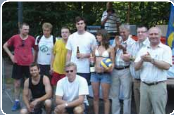
De gelegenhedsploeg 'Pino is ziek' won eind juni het volleybal-tornooi van KAVOK Overmere. Achttien ploegen namen deel.