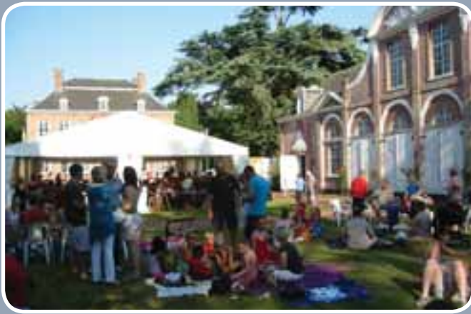
Genieten van een heerlijke picknick in het kasteelpark op zondag 11 juli.