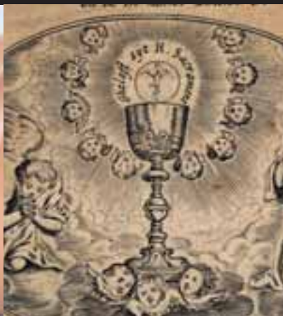
Ruilbeurs en rommelmarkt: 13 november