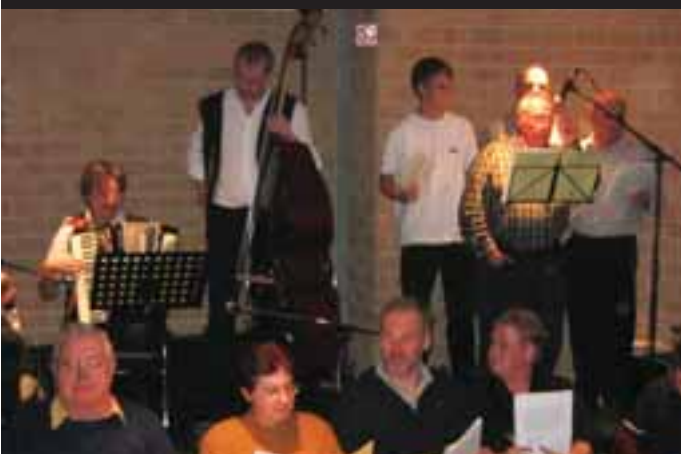
Zangstonde: 26 november

Je eigen activiteiten in deze UiTagenda? Voer ze in vóór 6 december via www.UiTdatabank.be .