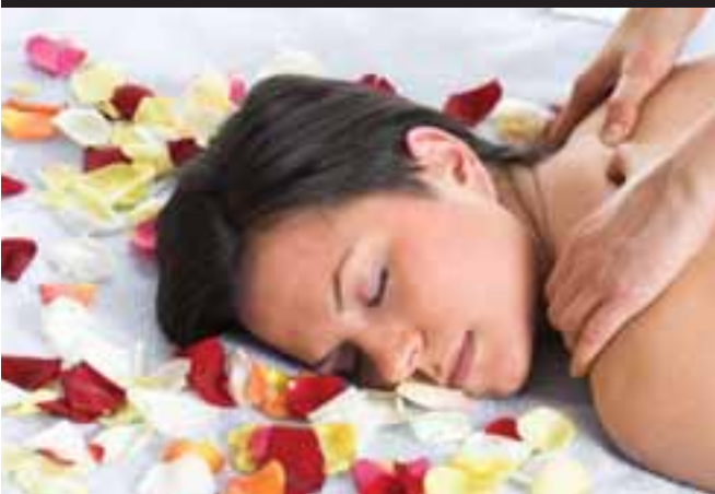
Cursus lichaamsmassage: 12 en 13 november

Meer UiTtips op www.UiTInBerlare.be en www.UiTInVlaanderen.be .