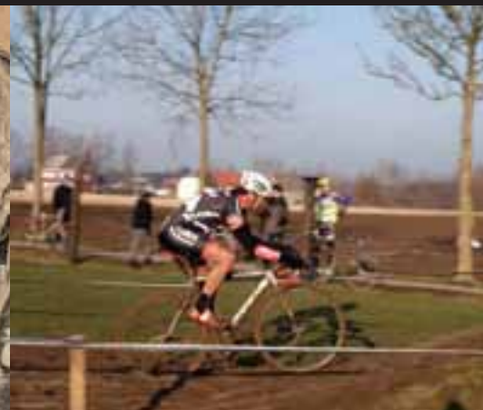
Veldritwedstrijd: 26 november