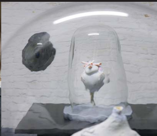
Tentoonstelling Chantal Pollier: zondag 18 maart