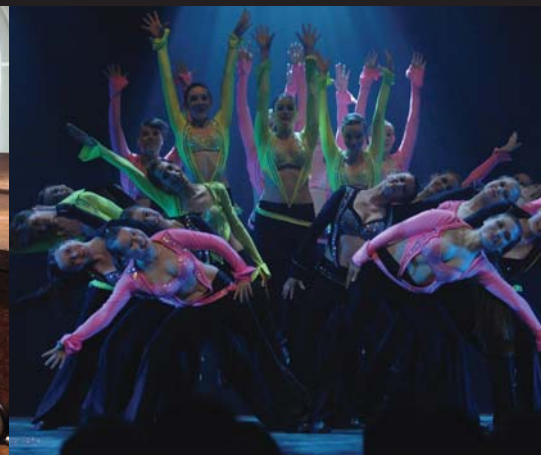
Start to run: vanaf 29 maart