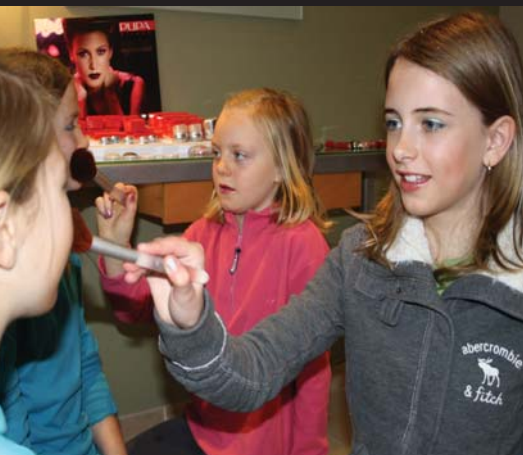
Skwat-dag: zaterdag 17 maart

Meer UiTtips op www.UiTInBerlare.be en www.UiTInVlaanderen.be .