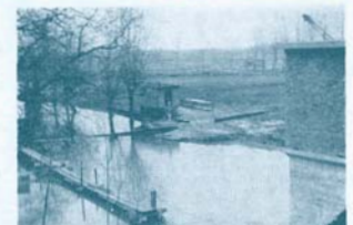
Een opeenvolgende van de werken.

In een pomphuis, dat op de plaats van de oude sluis gebouwd werd, voorzag men twee pompen elk met een vermogen van 40 m 3 per minuut en die het water van een gebied van 1.300 hectaren en van het Donkmeer zullen afvoeren. Deze automatische pompen staan aan wanneer het waterpeil stijgt en af wanneer het waterpeil zakt en af twee hulppompen elk met een vermogen van 5 m 3 waren ingeschakeld, doch niet in staat het overtollige water af te voeren. Huid erig nu was het mogelijk maken van verder te werken, zodat de polder en Overmeere-Donk nog een bad kregen!