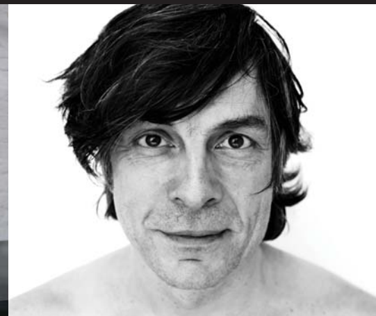
Kamagurka: zaterdag 24 maart