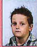
Opzij en schouders niet recht