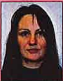
Gezicht en ogen niet volledig zichtbaar