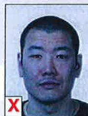
C. Onnatuurlijke weergave