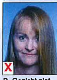
B. Gezicht niet volledig zichtbaar