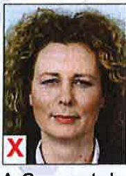
A. Geen neutrale blik