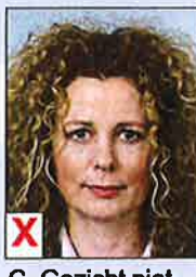
C. Gezicht niet volledig zichtbaar