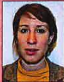
Mond niet gesloten