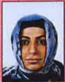
Gezicht niet volledig zichtbaar