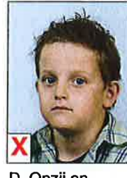
D. Opzij en schouders niet recht