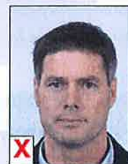
D. Onvoldoende contrast (flets)