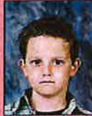
Achtergrond niet eenkleurig