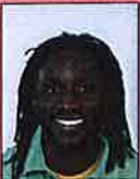
Mond open, tanden zichtbaar