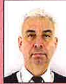
Onvoldoende contrast hoofd/achtergrond