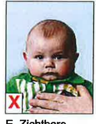
E. Zichtbare ondersteuning