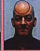
Reflectie en schaduw

Sommige foto's komen uit het document ICAO9303 en werden in de matrix opgenomen met de gewaardeerde toestemming van de International Civil Aviation Organization. FOD Buitenlandse zaken en FOD Binnenlandse Zaken - 12/2016