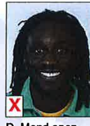
D. Mond open, tanden zichtbaar