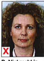
B. Niet recht in de camera kijken