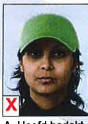
A. Hoofd bedekt