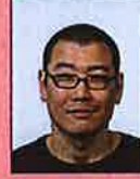
Ogen niet volledig zichtbaar