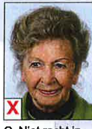
C. Niet recht in de camera kijken