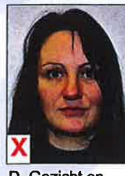
D. Gezicht en ogen niet volledig zichtbaar