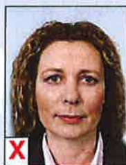
B. Optische vervorming