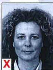
A. Zwart / Wit*