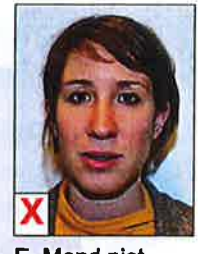
E. Mond niet gesloten