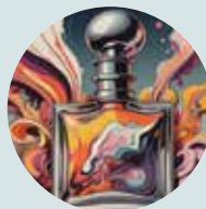
Zondag 21 juni Pistol Perfume