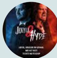
20 augustus tot 5 september Openluchtmusical Jekyll & Hyde