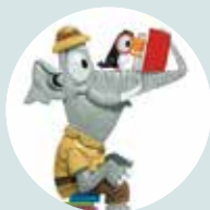
Woensdag 3 juni Voorleesmoment

plaats: Bibliotheek Berlare info: beleefberlare.be/digicoach